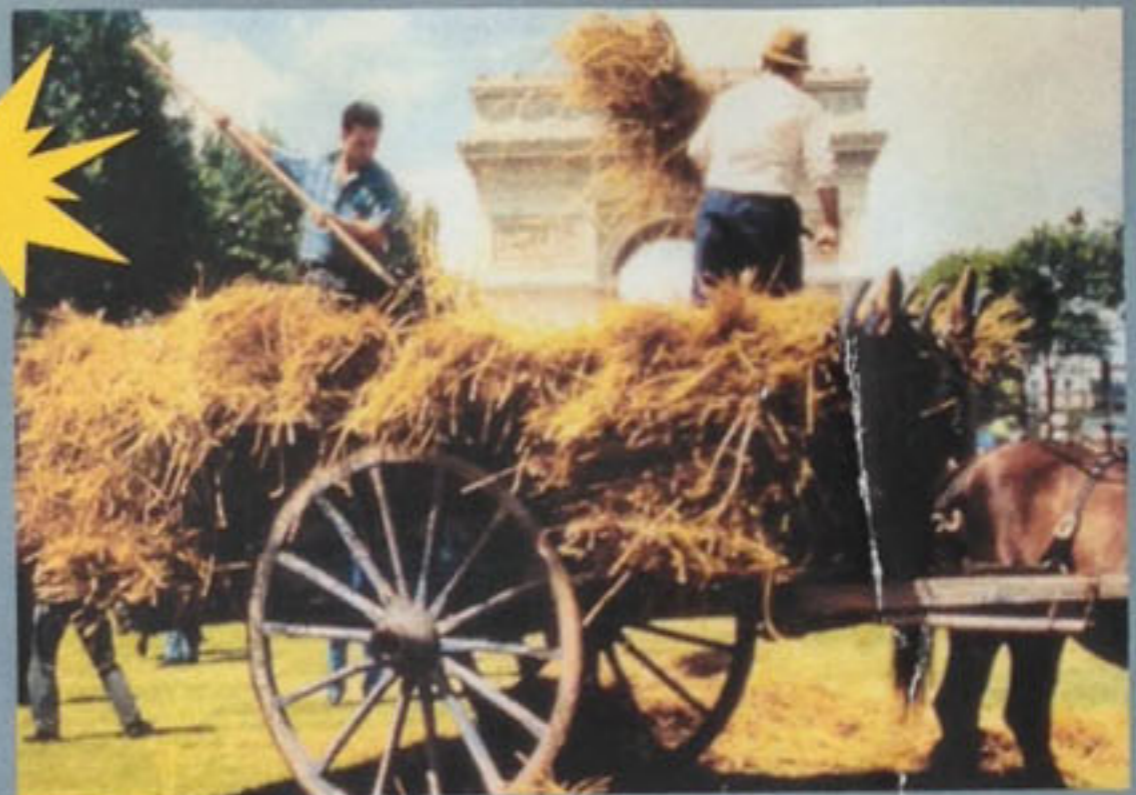
ΟΙ ΓΑΛΛΟΙ ΑΝΑΖΗΤΟΥΝ ΤΟ ΧΤΕΣ