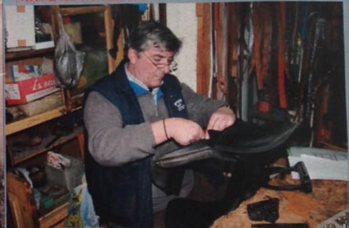
Ο ΑΝΘΡΩΠΟΣ ΠΟΥ ΕΚΑΝΕ ΤΗ ΣΕΛΑ ΤΕΧΝΗ