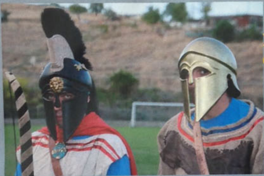
ΟΙ ΛΑΠΙΘΕΣ ΞΑΝΑ ΣΤΗ ΖΩΗ ΜΑΣ