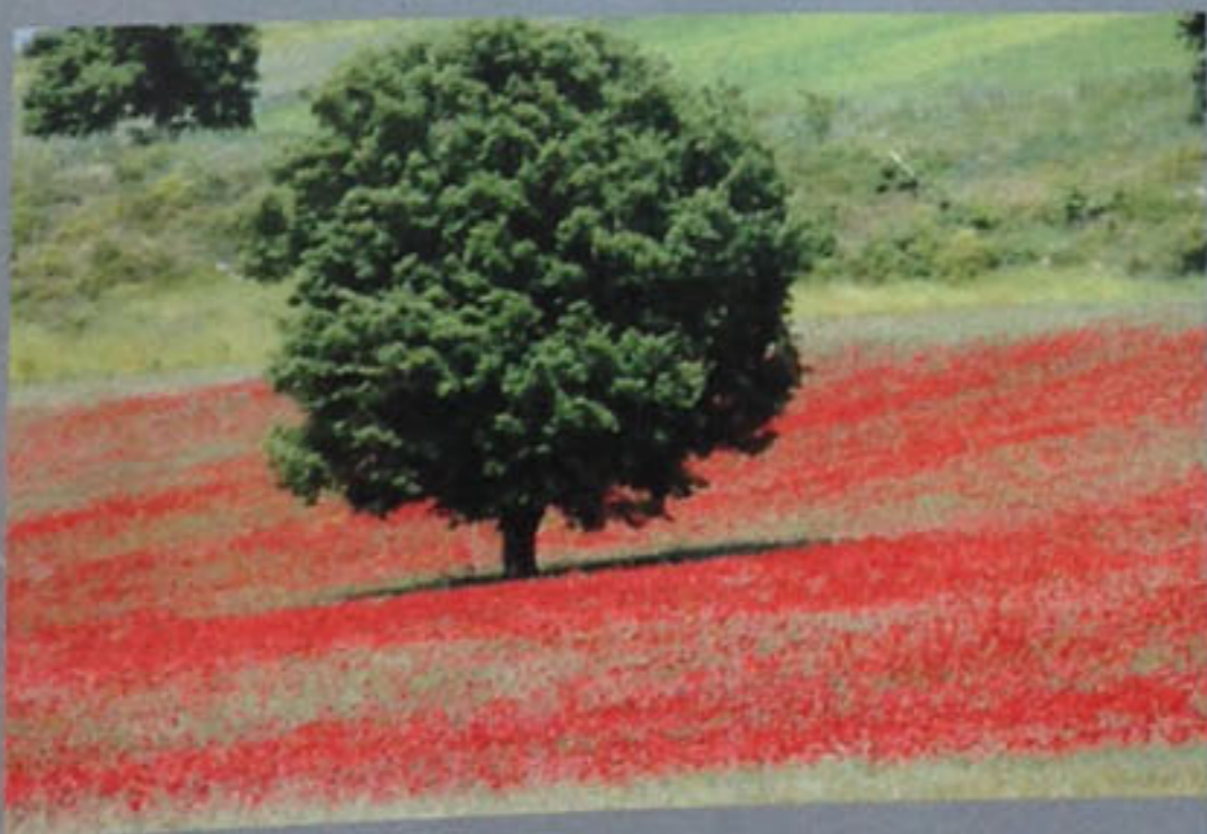
Η ΜΑΓΕΙΑ ΤΗΣ ΕΛΛΗΝΙΚΗΣ ΦΥΣΗΣ