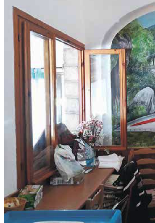
Templjarska freska v vaški gostilni.

ci, Nizozemci in Danci, a nobeno nima tako slavne zgodovine, predvsem pa ne svoje do zadnje podrobnosti premišljeno izdelane državnosti, kot jo ima Seborga. Ta državnost, deloma – kar sodi k vsaki pravi državnosti – skovana na mitu, je postala poleg vinarstva, oljkarstva in cvetličarstva tudi četrta gospodarska panoga. Trgovinice s spominki v labirintu uličic, ki povezujejo tipično tesno prepleteno ligursko arhitekturo, ponujajo številne materialne dokaze, da je Seborga prava, ne le namišljena kneževina. Tudi Seboržani sami, prepričani o bogati zgodovinski dediščini svojega kraja, jemljejo projekt neodvisnosti izjemno resno. Uličice krasijo seborške