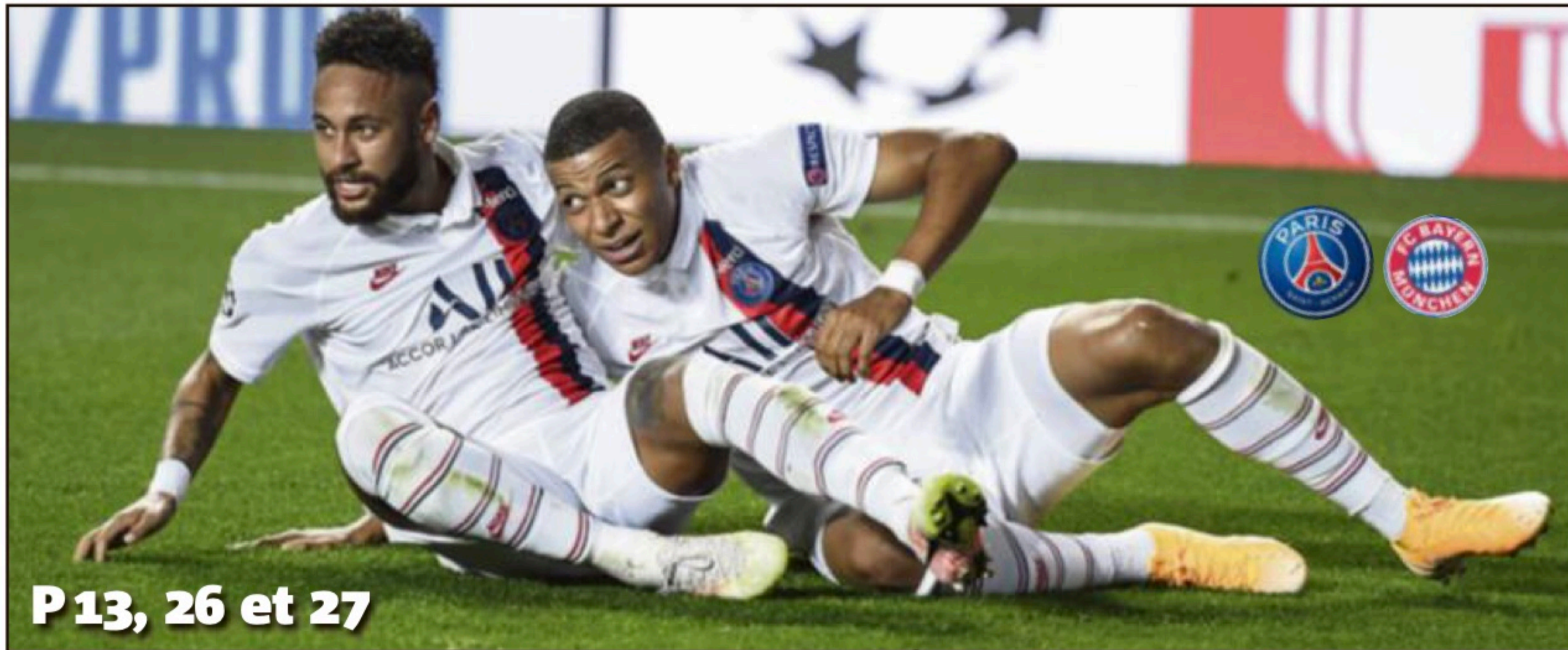
P 13, 26 et 27